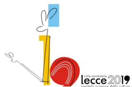
EUROPEAN CAPITAL OF CULTURE lecce 2019 EUROPEAN UNION